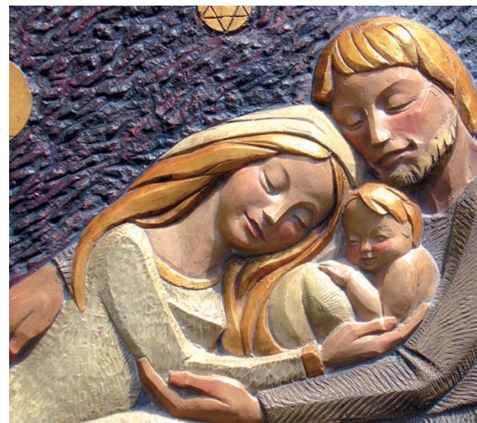
Sagrada Familia en resina.