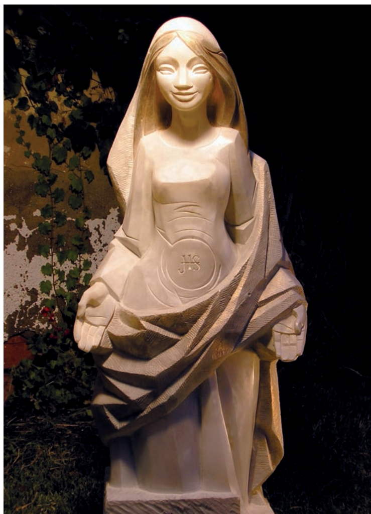
Virgen María en alabastro.

tualmente por encargo, explora actualmente la posibilidad de empezar a abrirse paso en el mundo de las exposiciones y las galerías. Algo, sin embargo, que no es nada fácil, porque, de alguna manera, está remando a contracorriente: «Las galerías y las salas de exposiciones, en general, excluyen de entrada la temática religiosa. La respuesta con que me rechazan alaba mi técnica y oficio pero lamentan la falta de sintonía con la línea que lleva la sala en cuestión.» Por otro lado, tampoco le resulta fácil introducirse en los espacios expositivos de la Iglesia, cuyos criterios son fundamentalmente arqueológicos y no suelen contemplar la posibilidad de exponer arte contemporáneo. «Me gustaría mucho exponer en las salas temporales de algún museo diocesano —acaba diciendo— porque así se subrayaría la pretensión de continuidad que tiene mi obra con respecto al patrimonio de otras épocas.»