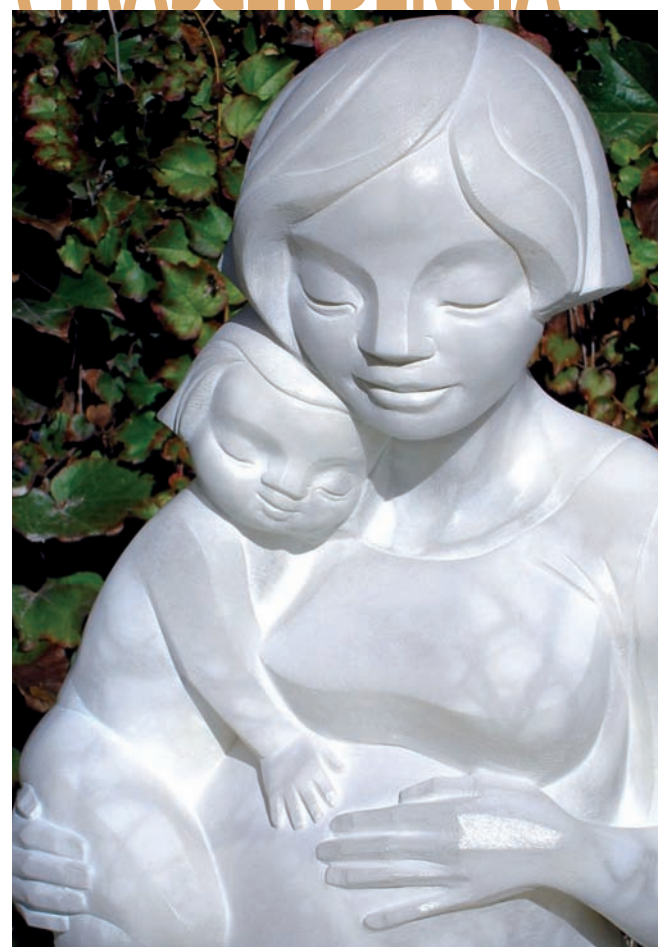
Madre moderna en alabastro.

tualmente por encargo, explora actualmente la posibilidad de empezar a abrirse paso en el mundo de las exposiciones y las galerías. Algo, sin embargo, que no es nada fácil, porque, de alguna manera, está remando a contracorriente: «Las galerías y las salas de exposiciones, en general, excluyen de entrada la temática religiosa. La respuesta con que me rechazan alaba mi técnica y oficio pero lamentan la falta de sintonía con la línea que lleva la sala en cuestión.» Por otro lado, tampoco le resulta fácil introducirse en los espacios expositivos de la Iglesia, cuyos criterios son fundamentalmente arqueológicos y no suelen contemplar la posibilidad de exponer arte contemporáneo. «Me gustaría mucho exponer en las salas temporales de algún museo diocesano —acaba diciendo— porque así se subrayaría la pretensión de continuidad que tiene mi obra con respecto al patrimonio de otras épocas.»