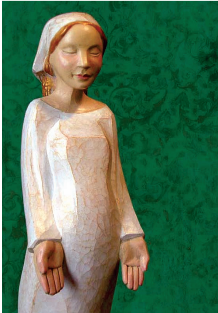
Virgen de la Esperanza.