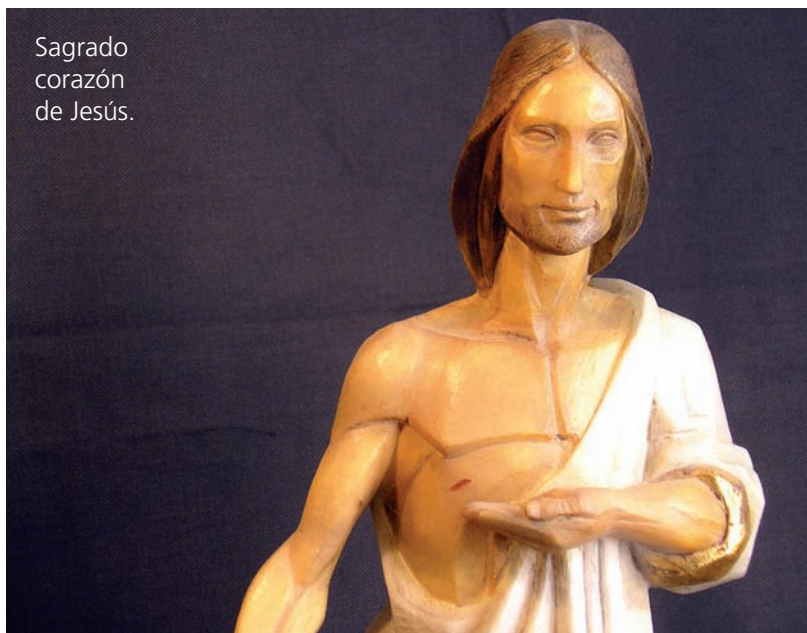
Sagrado corazón de Jesús.

de Dios invisible mientras María es el icono de la humanidad restaurada en toda su belleza original.» El mismo verano en el que terminó sus estudios en Barcelona talló en alabastro una Virgen con el niño, que se conserva aún en el colegio de las Vedrunas de Balaguer. Eran los primeros pasos de un artista fascinado por el misterio de la encarnación. «Hay algo muy bello en el amor humano y en la maternidad —sostiene—, pero cuando Dios elige desposar a una mujer de nuestra raza y habitar en un seno, esta belleza adquiere una magnitud que nunca antes había concebido la