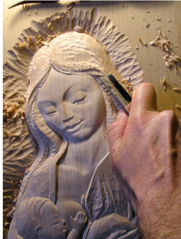
Virgen de la Leche en madera de haya.

ellos. «La contemplación de la belleza, en nuestro caso de una obra de arte, puede llevar a la oración —apunta—, y la oración desemboca en la contemplación, aunque un nivel superior que el que había suscitado la contemplación estética inicial.» Y añade: «La sed de Dios está siempre ahí, en el corazón humano, y el arte, como toda forma de belleza, despierta esa añoranza de Dios.»